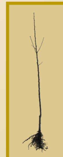
Oltott/szemzett suháng (S0)