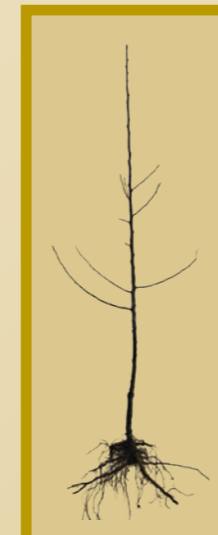
Szemzett Koronás/Knipp fa min. 3 ággal (K3+)